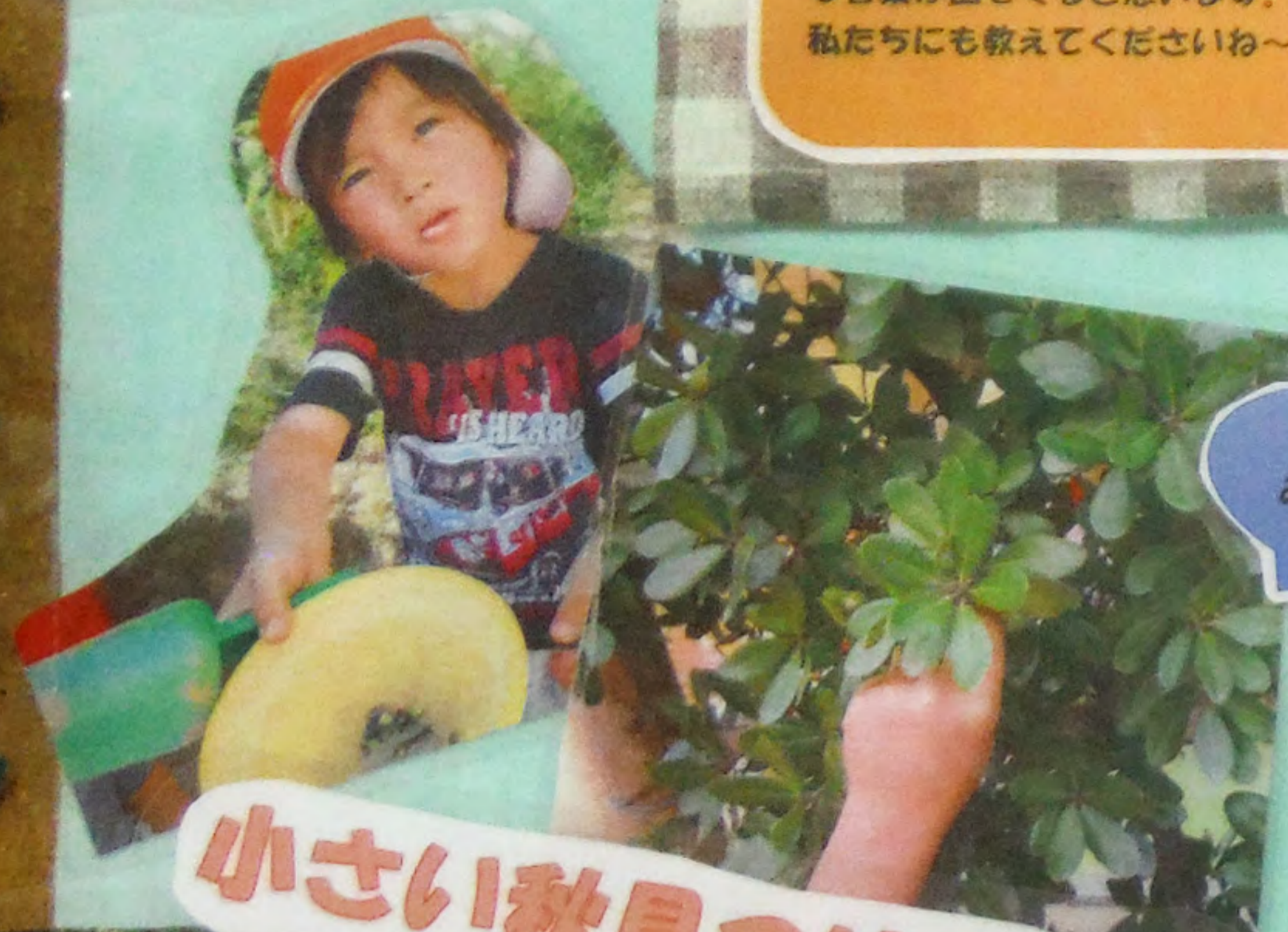
小さい秋見つけた～♪

小さな秋がたくさん見つかってきました。植物を探る中で、ペンギン組のお友だちがかわいらしい言葉も出てきました。色が変わった様子や、枯れていく様子などお家でも季節の変化を話してみてください。きっと子どもらしい素敵な言葉が出てくると思います。そんなエピソードをぜひ、私たちにも教えてくださいね～