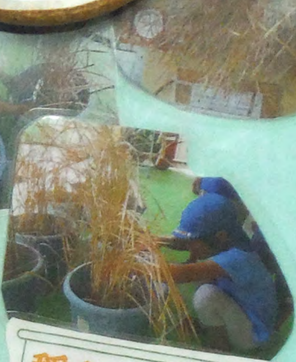
稲を刈り、干して、脱穀、もみすり、精米作業へ